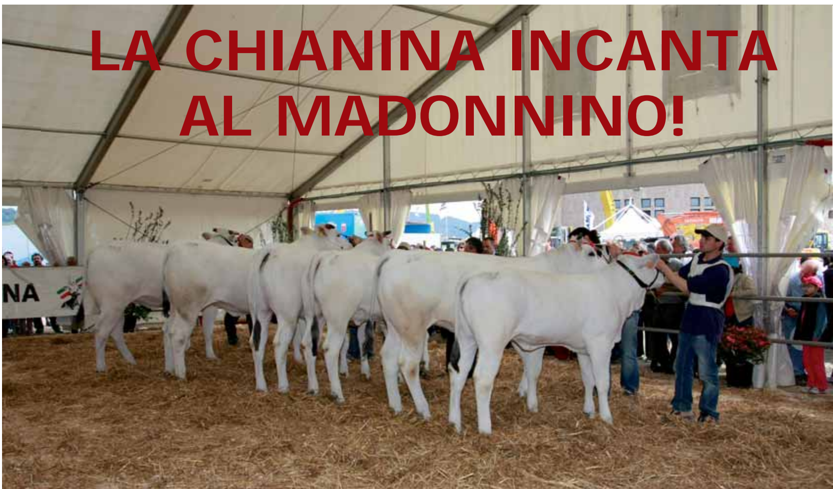
La finale delle femmine Junior