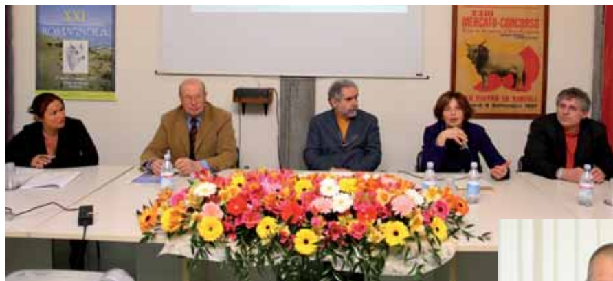
I relatori del convegno