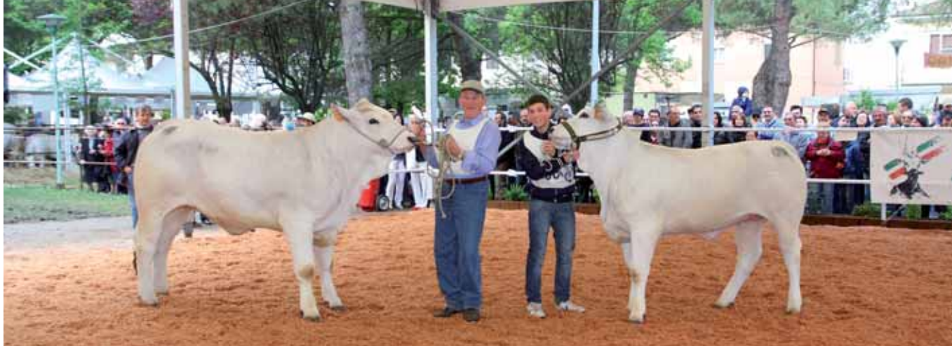
Da sinistra, Tosca delle Querce e Unica della Mezza Cà, Campionessa e Riserva Assolute Femmine Junior.

contenere la superiore muscolosità e la straripante robustezza strutturale della 1a classificata.