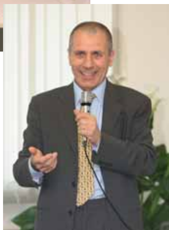
Il Prof. Arcangelo Gentile

dettagli gli aspetti operativi legati alla ristrutturazione del Centro Genetico di S. Martino in Colle, sottolineando l'importanza del centro di prelievo e stoccaggio del materiale seminale. Questo concetto è stato ripreso da Matteo Ridolfi che ha illustrato i criteri che devono regolare l'impiego dei tori testati giovani in popo-