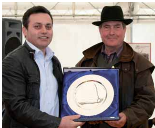
Il Presidente Anabic premia l'azienda di Musignano

assegnata la coccarda azzurra quale vacca più produttiva in categoria, con accesso alla finale per l'attribuzione del Trofeo Lucio Migni.