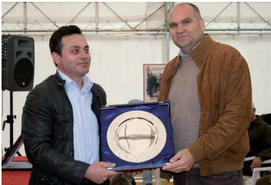
La premiazione della Soc. Vitivinicola, Miglior Espositore dell'Anno

di Romano Palazzo Ufficio Centri Genetici