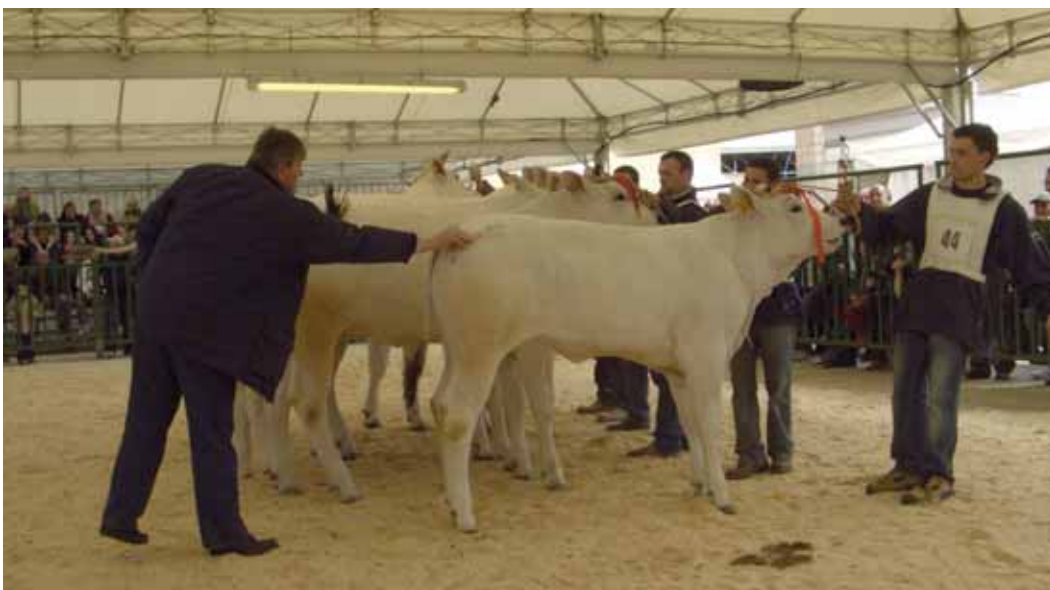
La proclamazione della campionessa Junior