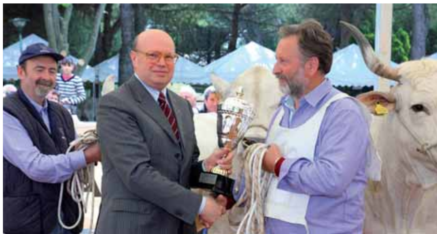
La premiazione dell'Azienda "La Viola" come Miglior Allevatore ed Espositore dell'Anno" e Miglior Gruppo di Allevamento.