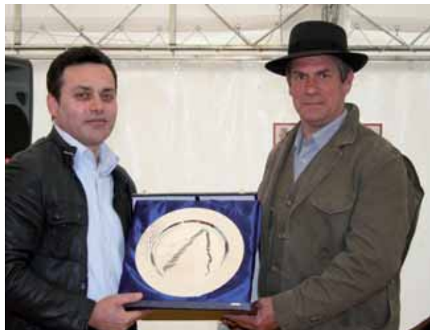
La premiazione della Tenuta di Castelporziano