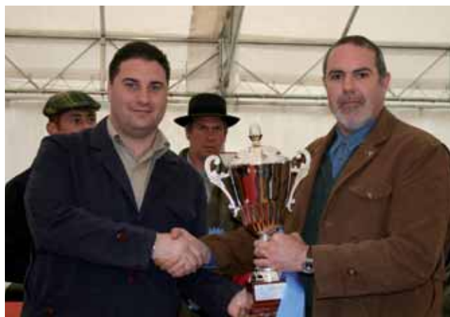
L'Azienda Mascetti - Sbardella riceve il trofeo "Lucio Migni"